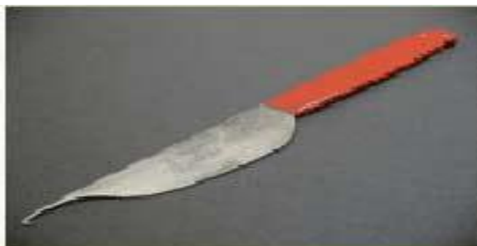
شکل ۲- چاقو قلاب

نوعی چاقو است که نوک آن حالت قلاب داشته و برای بافت و گره زدن خامه‌ها و نیز بریدن آن‌ها استفاده می‌شود. تیز بودن تیغه و مناسب بودن نوک قلاب مانند و راحتی و انحناء دسته چاقو تاثیر زیادی در سرعت عمل بافنده دارد.