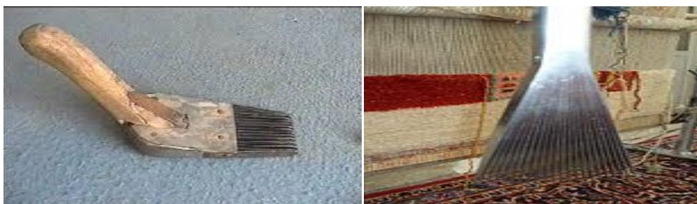
شکل ۴- دو نوع دفه (دفتین)

نوعی ابزار فلزی دارای دسته و دندانه‌های شانه مانند است که برای درهم تنیدن گره‌های زده شده بعد از پودگذاری در پایان هر رج، مورد استفاده قرار گرفته و به وسیله بافنده با ضربات متناسب و منسجم باعث استحکام بافت می‌شود. (بافنده پس از گذراندن هر پود افقی از لابه‌لای تارهای عمودی با کمک آن ضرباتی بر قسمت بافته شده وارد می‌کند تا درگیری تار و پود و عمل بافت صورت گیرد). جنس دفه (دفتین)‌های مصرفی معمولاً آهن است و از تعداد هفت تا ده تیغه آهنی نازک به عرض دو و طول بیست سانتی‌متر تشکیل می‌شود. دفه (دفتین) زدن باید با روش اصولی انجام گیرد. بالا و پایین کردن دفه (دفتین) توسط حرکت آرنج صورت گرفته و از حرکات اضافی شانه و کتف باید جلوگیری شود.