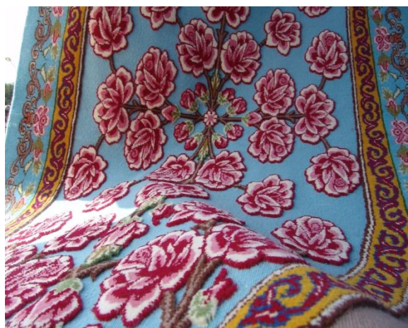
شکل ۱- گلیم نقش برجسته ایلام

بافته‌ای تلفیقی از گلیم ساده به عنوان زمینه و اجرای نقوش با استفاده از گره متقارن قالی (ترکی) در زمینه گلیم که باعث ایجاد بافته‌ای می‌شود که طبیعتاً بعد از بافت، نقوش آن به صورت برجسته است. به این نوع خاص گلیم، گلیم نقش برجسته ایلام گفته می‌شود.