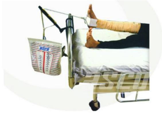
شکل ۲- تراکشن پوستی