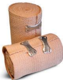
شکل ۳ - باند کشی

باندی که از الیاف طبیعی تولید شده و بافت کشی دارد، اکسیژن به راحتی به بافت زیری آن می رسد و به منظور محافظت محل آسیب دیده و کاهش ادم، حفاظت و ثابت نگه داشتن پانسمان و موارد بازتوانی و صدمات کاربرد دارد. این باند بیشتر در اندام های انتهایی جهت جلوگیری از ادم و حمایت وریدهای واریسی کاربرد دارد (به شکل ۳ مراجعه شود).