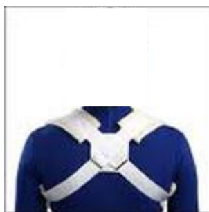
شکل ۱- بانداز ∞

بانداز ∞ که نوار مخصوص شکستگی ترقوه نامیده می شود، دارای بندهایی است که با استفاده از آنها می توان اندازه آن را تنظیم کرد، این بانداز برای جلوگیری از صدمات فشاری روی شبکه عصبی بازویی و شریان زیر بغلی (آگزیلاری)، در حفره زیر بغل دارای ویبریل یا بالشتک های نرم می باشد. با استفاده از این نوار مخصوص می توان شانه ها را به طرف عقب کشید و شکستگی را جا انداخت و بی حرکت نمود (به شکل ۱ مراجعه شود).