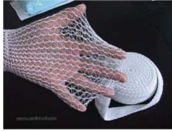
شکل ۱- سرجی فیکس