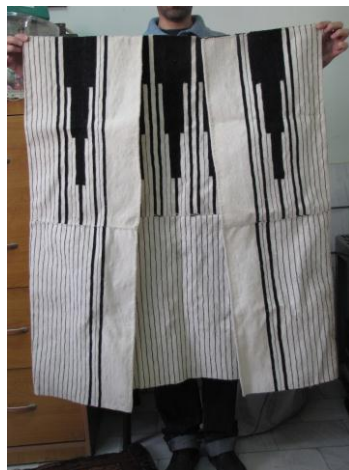
تصویر ب ۴- چوغا (بالاپوش) بختیاری