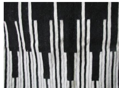
تصویر ب ۳ - گُل (پَنچِه)