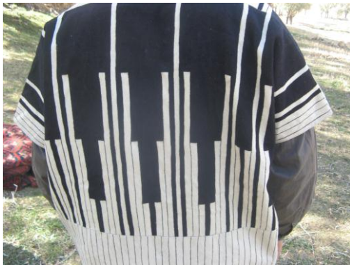
تصویر ب ۲- بالاتنه (مِلاشون) چوغا