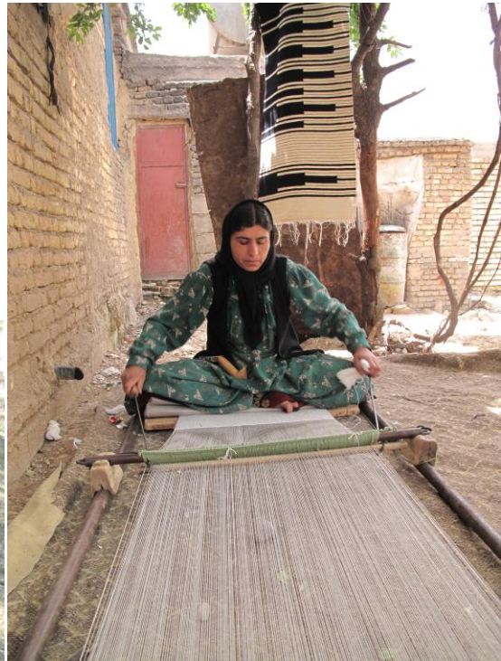
تصویر ب ۱ - دار چوغا باقی