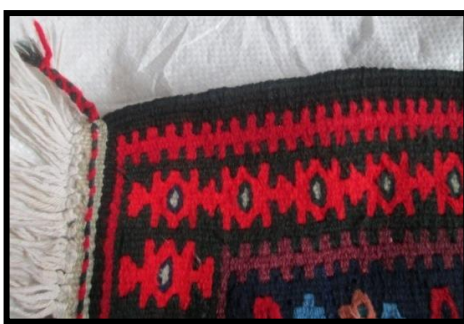
شکل ۸- شمشیری شدن

انحنایی شبیه خمیدگی شمشیر که در ابتدا و انتهای گلیم در اثر مهار نکردن نخ‌های چله در قسمت زیر دار به وجود می‌آید.