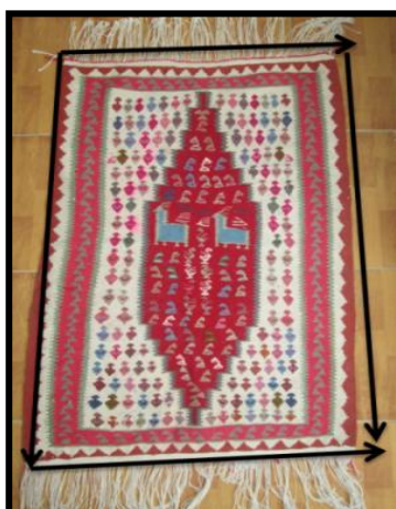
شکل ۶- سره در طول و عرض

کجی گلیم که در اثر کشیدگی نخ‌های پود یا کوبیدگی بیش از حد دفتین ۱ به وجود می‌آید. در صورتی که سره در راستای چله باشد، سره در طول و در صورتی که سره در راستای عرض باشد، سره در عرض نامیده می‌شود.