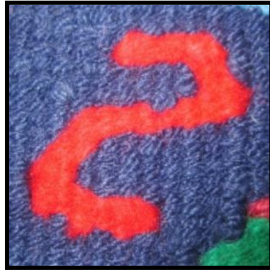
شکل ۱۹- ماره ژوه