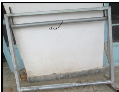
شکل ۲- دار فلزی متحرک (فندک‌دار)

یادآوری - امروزه معمولاً از دارهای فلزی متحرک (فندک‌دار) استفاده می‌شود.