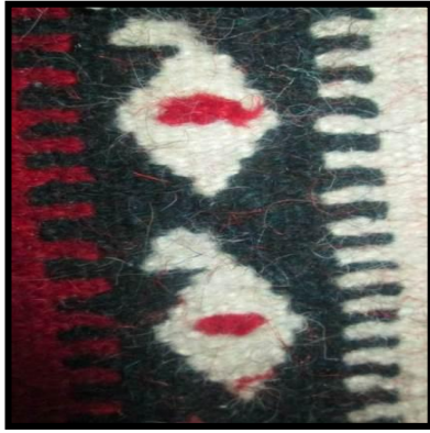
شکل ۱۴- بُته جِقَه (ترمه)