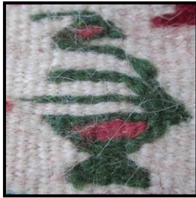
شکل ۱۶- پرنده