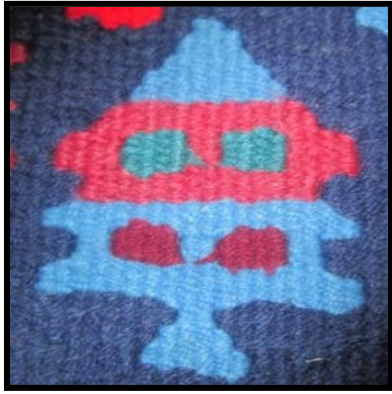
شکل ۲۰- مریمی