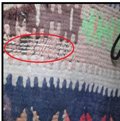
شکل ۴- بیدزدگی

یادآوری - معمولاً گلیم‌های بافته شده توسط عشایر منطقه، در لبه‌های بیرونی، دارای حاشیه باریکی از موی بز (اغلب به رنگ سیاه) هستند، این حاشیه موجب افزایش استحکام لبه‌ها، افزایش مقاومت لبه در برابر ساییدگی در اثر راه رفتن، افزایش مقاومت در برابر پوسیدگی در اثر رطوبت و هم‌چنین مصون ماندن گلیم در برابر آسیب حشرات (به طور مثال بیدزدگی) می‌شود ولی امروزه به دلیل عدم دسترسی به موی بز، بافت آن به ندرت انجام می‌شود (به شکل ۴ مراجعه شود).