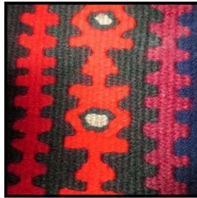
شکل ۲۱- چنگ پشی (پنجه گربه)