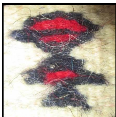
شکل ۱۲- مفرشی (عروسکی)