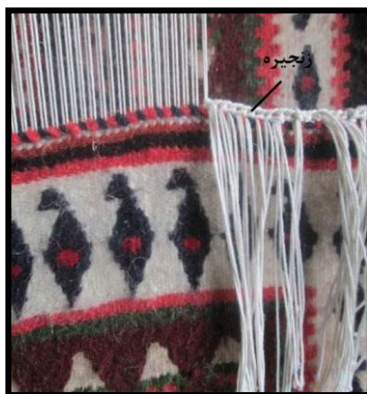
شکل ۳- زنجیره