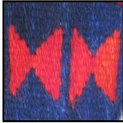
شکل ۱۵- قرقره