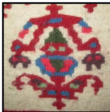
شکل ۹- گل سجاده