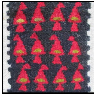
شکل ۱۷- مِل چَفته (گردن کچ)