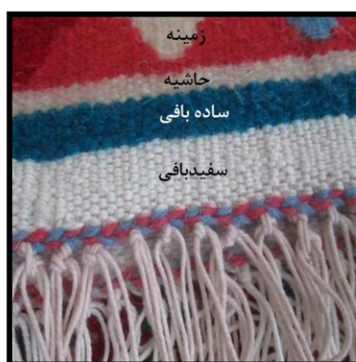
شکل ۵- سفیدبافی، ساده‌بافی، حاشیه و زمینه

بافتی که پس از حاشیه، از تکرار نقش‌ها، متناسب با ذوق و سلیقه ذهنی بافنده ایجاد می‌شود.