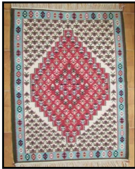
شکل ۱- نمونه‌ای از گلیم کرمانشاه (هرسین)

نوعی دست‌بافته‌ی بدون پرز که با درهم تنیده شدن نخ‌های تار و پود و با استفاده از دار عمودی بافته می‌شود. در این استاندارد از این پس، گلیم کرمانشاه (هرسین) به اختصار گلیم نامیده می‌شود.