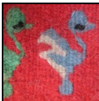
شکل ۱۱- مرغابی