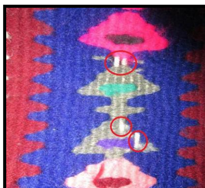
شکل ۷- نخ‌نما شدن

نمایان بودن نخ‌های چله در سطح گلیم که در اثر اشکال چله‌کشی (شل یا سفت بودن چله) یا نامنظم بودن نخ‌های پود به وجود می‌آید.