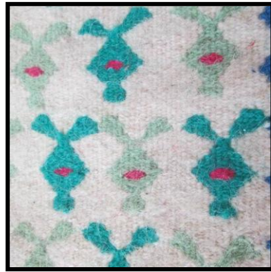
شکل ۱۳- خرگوشی