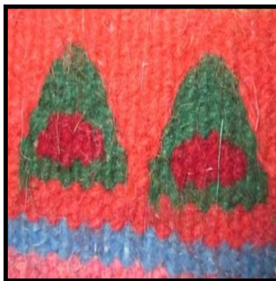
شکل ۲۳- سه گوش