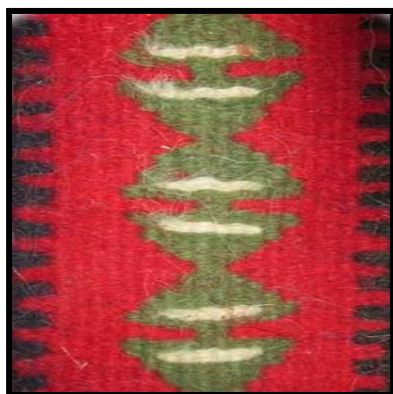
شکل ۱۰- گل قندانی

یادآوری - با توجه به این که بافت گلیم بر اساس سلیقه و افکار بافنده انجام می‌شود ممکن است یک طرح با چند رنگ مختلف و یا طرحی با یک رنگ ولی در اندازه‌های مختلف بافته شود. این کار نه تنها باعث کاهش ارزش گلیم نمی‌شود بلکه باعث زیباتر شدن و افزایش ارزش آن نیز می‌شود.