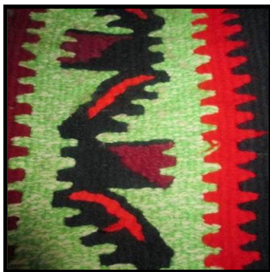
شکل ۱۸- بادبزی (قاچ خربزه)