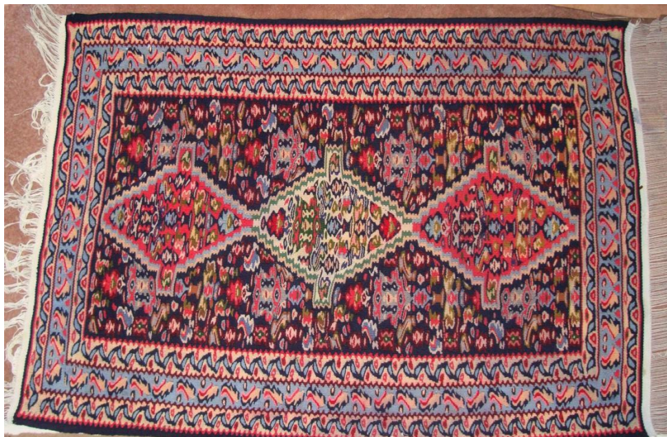
شکل الف-۲ نمونه ای از گلیم کردستان (طرح ماهی درهم -سه ترنج)