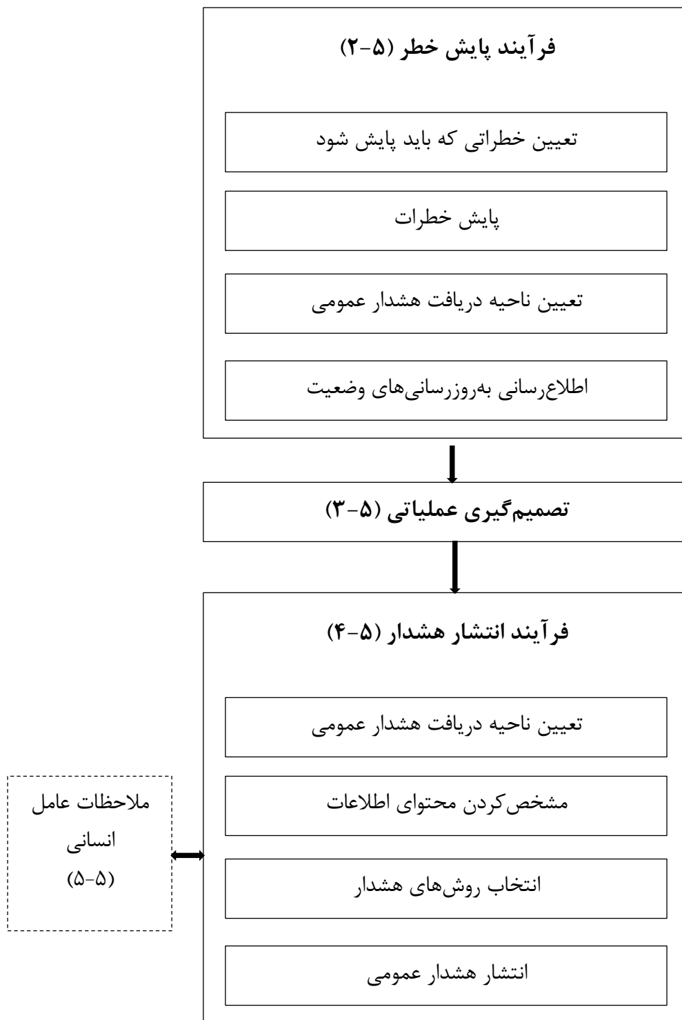
شکل ۲ - مرور کلی فرآیند هشدار عمومی