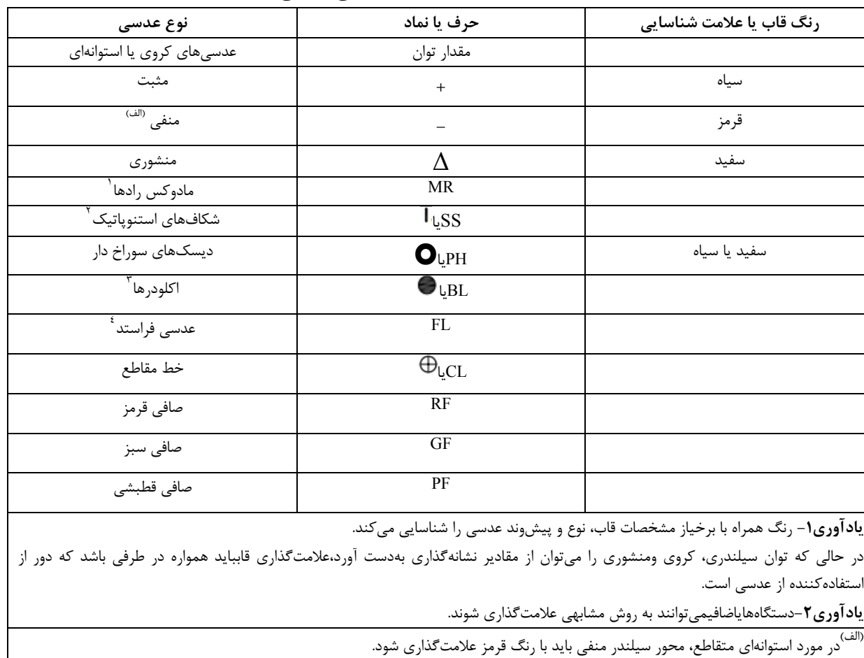
جدول ۷- علامت‌گذاری‌های شناسایی عدسی‌ها