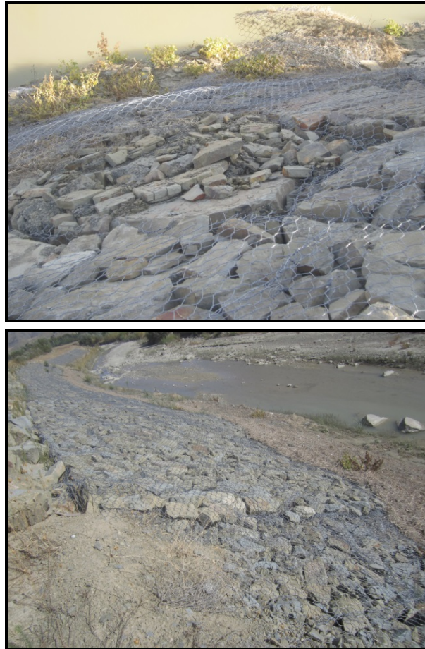
شکل ۴-۱- نمونه‌هایی از رخدادهای خرابی در توریسنگ‌ها