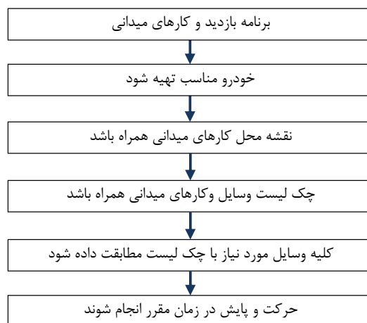
شکل ۵-۳- آماده‌سازی و اقدام برای بازدید