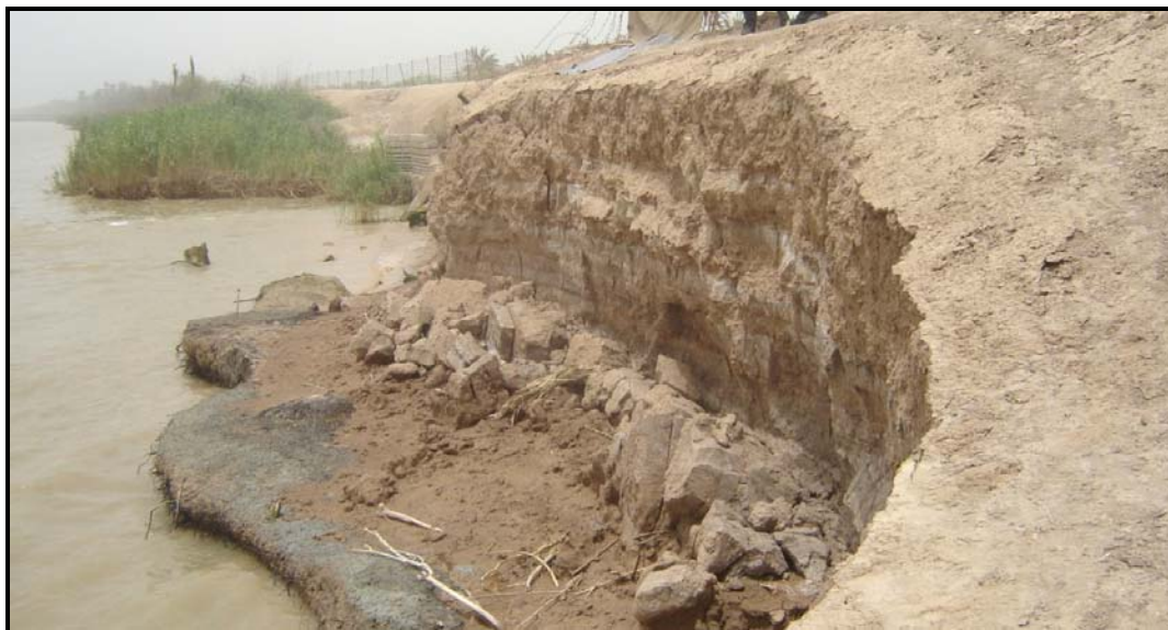
شکل ۲-۲- نمونه‌ای از رخداد پدیده ریزش کناره رودخانه