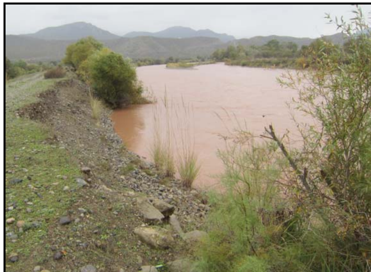
شکل ۲-۱- نمونه‌ای از فرسایش گوره

اين نوع از فرسایش در سطح بدنه سازه به وقوع می‌پيوندد. فرسایش سطحی ممکن است در اثر جريان رودخانه و يا عواملی نظير بارش، تردد و ... ايجاد شود. اين نوع از فرسایش در سازه‌هاي انعطاف‌پذير سنگي و خاکی که پيوستگي بين اجزای تشکيل‌دهنده سطح وجود ندارد مشاهده می‌شود. در مورد گوره‌ها، شيروانی‌هاي طرفين و تاج گوره در معرض فرسایش‌هاي ناشی از باد، باران و جريان آب می‌باشند. معمولاً استفاده از پوشش گیاهی برای تثبيت تاج و شيروانی سمت خشکی گوره‌ها مناسب می‌باشد [۷]. در مورد شيروانی سمت رودخانه و يا در مواردی که به علت بارندگی‌هاي سنگين پوشش گیاهی توانایی حفاظت شيروانی سمت خشکی تاج سازه را نداشته باشند، از پوشش‌هاي حفاظتی مناسب‌تری برای حفاظت در برابر فرسایش استفاده می‌شود. حفاظت شيروانی سازه در سمت رودخانه ممکن است از دو طريق حفاظت‌هاي مستقیم و يا غيرمستقیم صورت پذيرد. حفاظت مستقیم می‌تواند شامل تمامی روش‌هاي پوشش کناره‌ها باشد. در روش غيرمستقیم، از طريق احداث سازه‌هايی نظير آب‌شکن، جريان را از پای سازه منحرف می‌کنند. در مورد سازه‌هاي سنگي نیز ابعاد در نظر گرفته شده برای سنگ‌دانه‌ها باید به گونه‌ای انتخاب گردد که جريان رودخانه و يا عواملی نظير نزولات جوی، موجب جابجایی آن‌ها نشود [۸]. جزئیات طراحی و اطلاعات کامل در مورد پوشش‌هاي حفاظتی در مرجع مختص آن [۸] ارائه شده است.