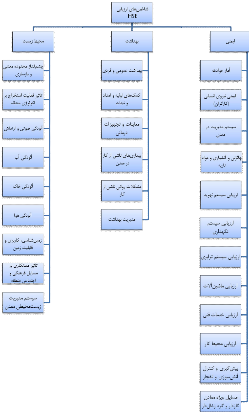
شکل ۱-۱- شاخص‌های ارزیابی HSE